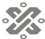
Cuadro 1. Objetivos del Consejo de Evaluación del Desarrollo Social (Evalúa CDMX)